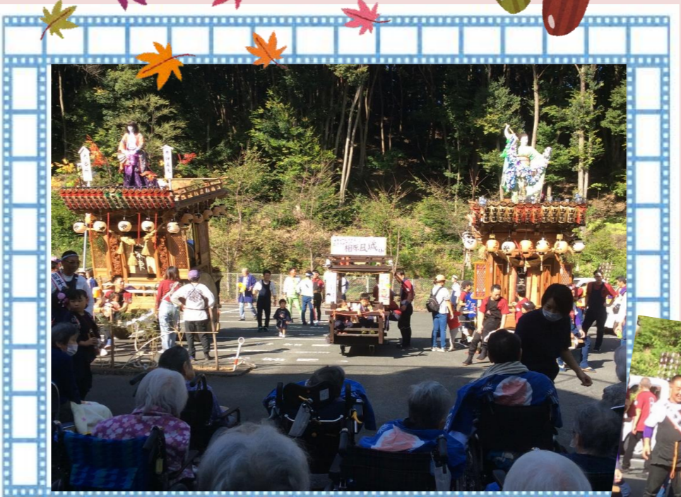
屋台来苑(大当所▶敷南連)