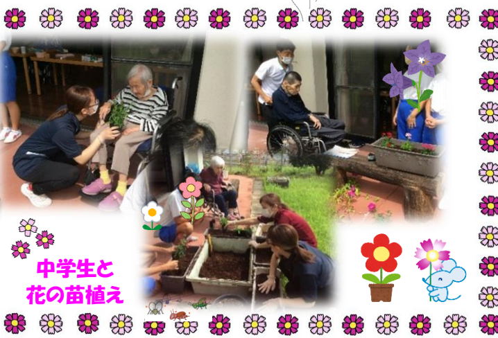
中学生と 花の苗植え